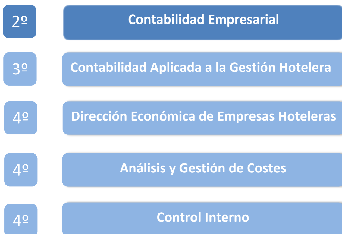
Gráfico 1: MÓDULO FORMATIVO CONTABILIDAD, AUDITORÍA Y CONTROL DE GESTIÓN del Diploma Superior en Gestión Hotelera

Dentro del plan de estudios, la asignatura está incluida en el módulo formativo denominado CONTABILIDAD, AUDITORÍA Y CONTROL DE GESTIÓN. En el siguiente cuadro se puede observar de modo más gráfico su ubicación en el conjunto del módulo formativo, y en el curso correspondiente dentro de los 4 cursos que abarca la titulación de Diploma Superior en Gestión Hotelera