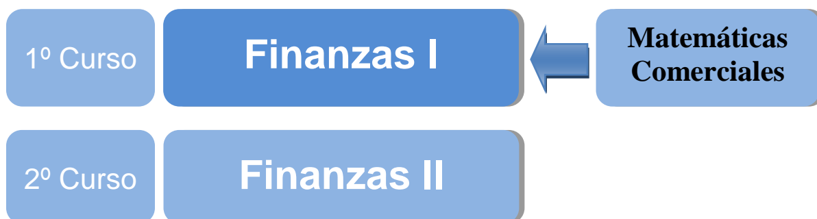
Gráfico 1: Principales relaciones de la asignatura con el resto de asignaturas del área de Administración de Empresas del Certificado de Elaboración y Gestión en Cocina.

La asignatura de FINANZAS I se enmarca dentro del área de Administración de Empresas del Certificado de Elaboración y Gestión en Cocina. En éste área también se incluyen las asignaturas de MATEMÁTICAS COMERCIALES impartida también en el primer curso del Certificado. En el segundo curso continúa la formación en el área de gestión empresarial con la asignatura FINANZAS II que completará los conocimientos fundamentales del área en administración de empresas.